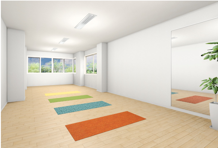
●レクリエーション室