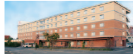
万が一のときに強い「免震構造」を採用したラ・デュース恵み野。

安全性にこだわったバリアフリー構造で、使いやすい居室やデイルームです。万が一に備えた年4回の避難訓練も行っています。