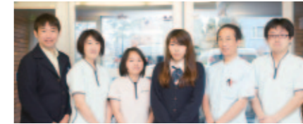
健康サポートも万全のラ・デュース恵み野デイサービスセンター。

お一人おひとりが毎日を明るく、ゆとりを持って過ごせるように専門分野に精通したスタッフが心を込めてサポートしています。