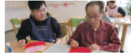
専門学校の学生たちとの交流会も盛んに行われています。

滋慶学園グループの学生たちとの交流イベントなど、多くの行事を開催してお一人おひとりの生活スタイルをサポートしています。