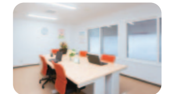
↑ お仕事さぼ〜とセンター