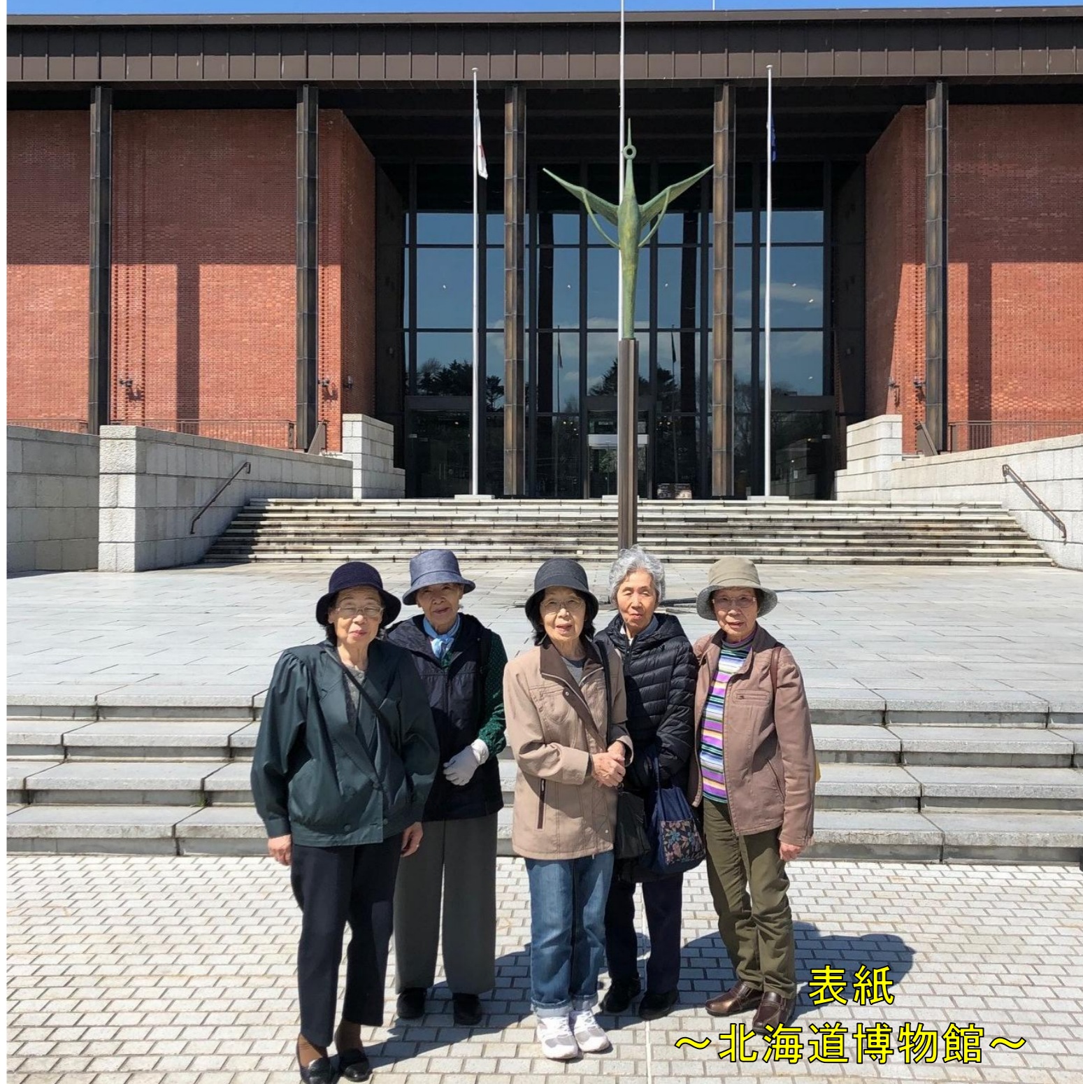
表紙 ～北海道博物館～