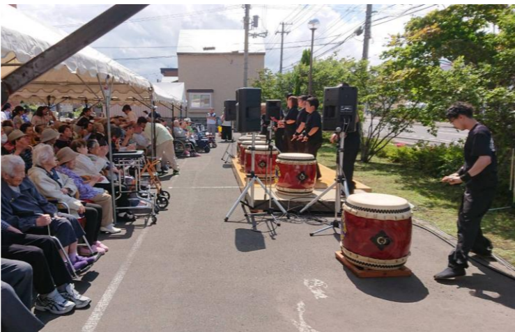
↑迫力のある太鼓のステージ

毎年開催しているラ・テュース恵み野夏祭りに参加してきました。天候が心配でしたが雨は降らずに開催することができました。ステージではフラダンス、太鼓、歌、職員の余興で盛り上がっていました。グループ校の札幌放送芸術&ミュージック・ダンス専門学校からはアイドルグループも来てくれたようです。屋台では、とうきび、焼き鳥、ビールが販売されて好評だったようです。高齢になるとなかなか夏祭りに参加する機会が無いと思いますので、みなさんに夏を感じただけで良かったです。