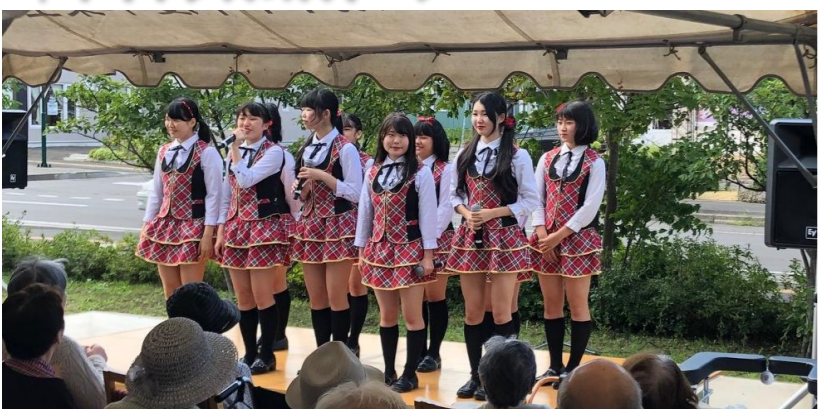
↑リアル女子高生アイドルSO.ON project 札幌支部