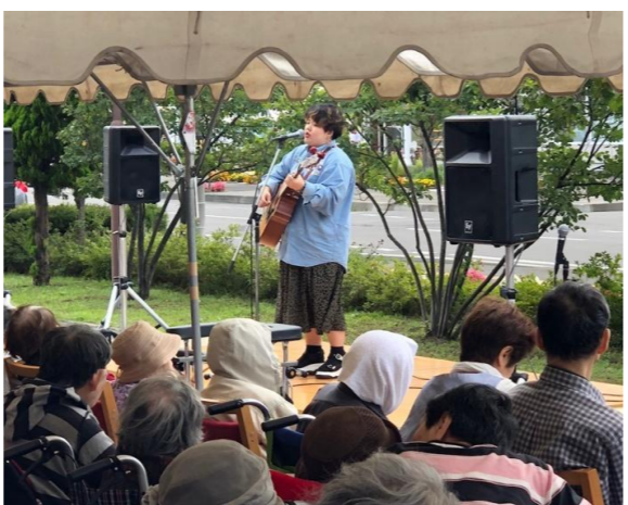
↑グループ校の札幌放送芸術&ミュージック・ダンス専門学校のみなさん