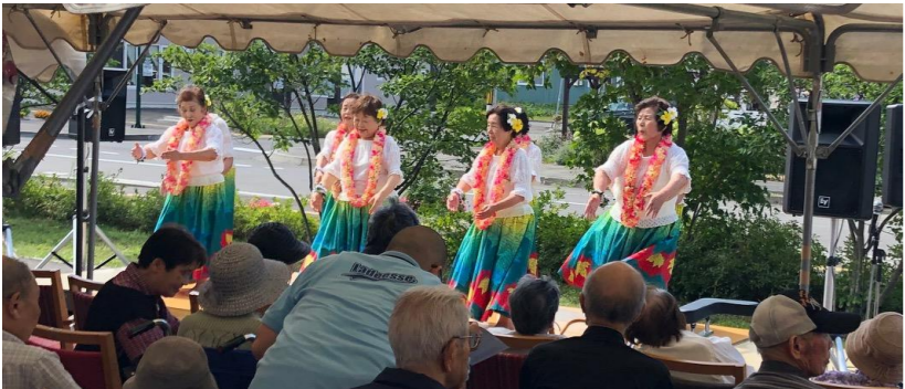
↑フラダンスのステージ