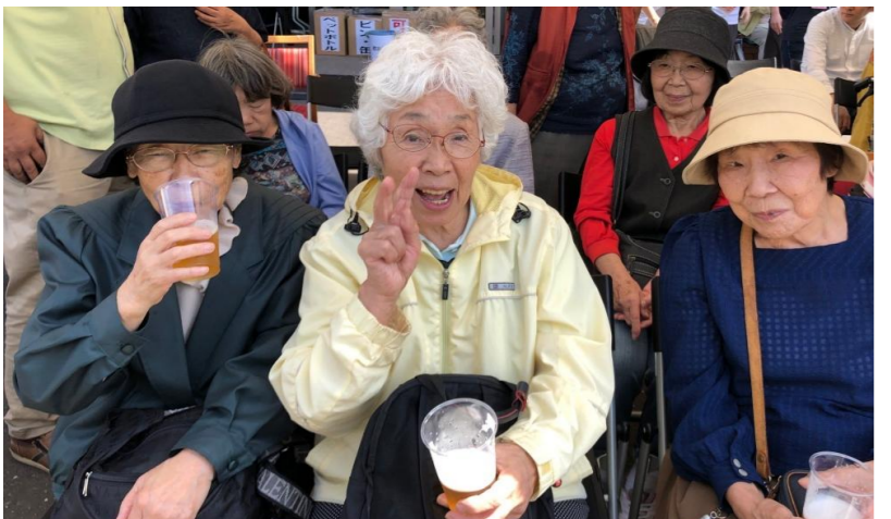
↑夏祭りのビールは最高！！