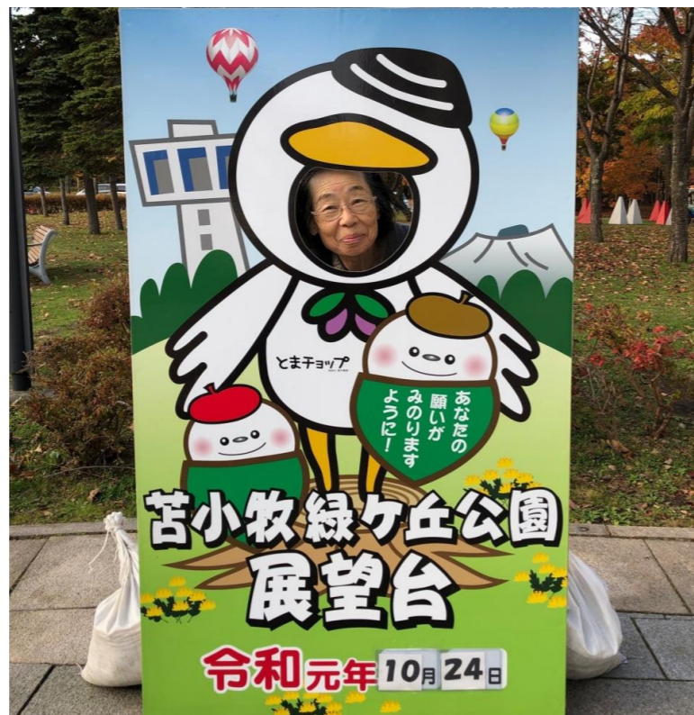
↑ 苫小牧緑ヶ丘公園の展望台です。苫小牧市の街並みや紅葉が綺麗でした。とまショップの中にあるのは…？