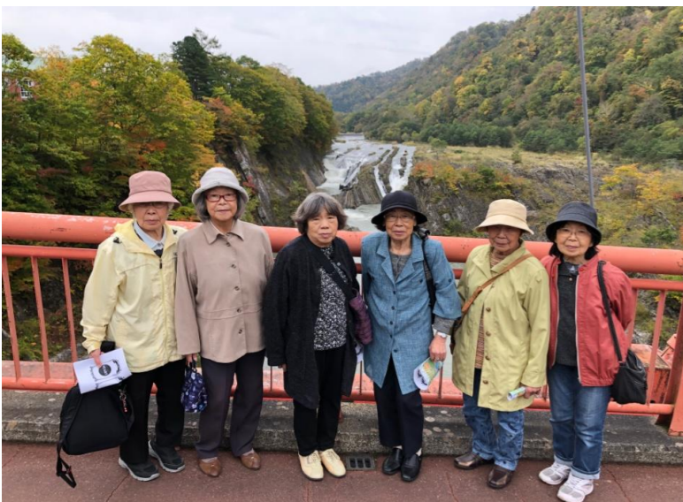
↑ 夕張の紅葉山です。橋から滝が見えました。