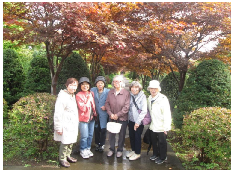
↑ 平岡樹芸センターの紅葉です。