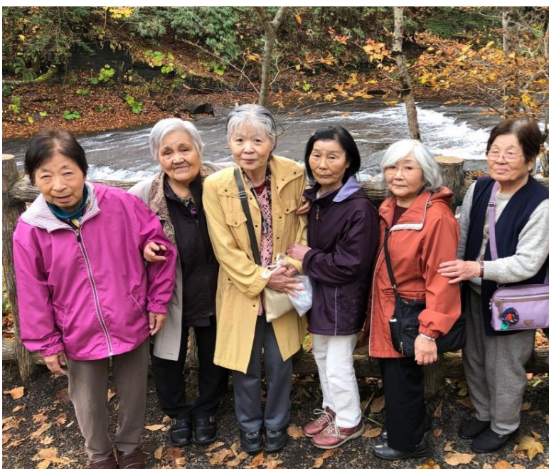
↑ 恵庭溪谷の白扇の滝に行きました！