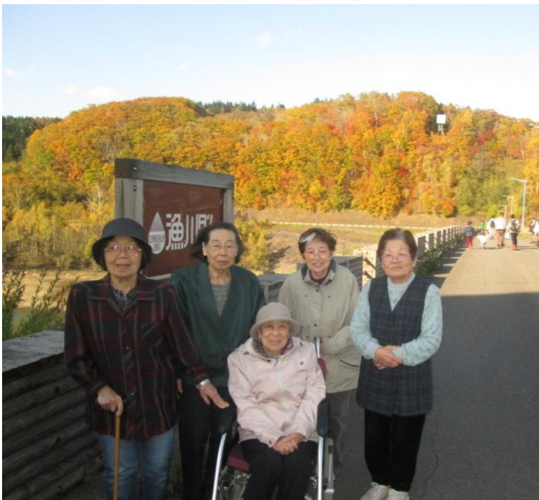
↑ 漁川ダムの紅葉を観に行きました！