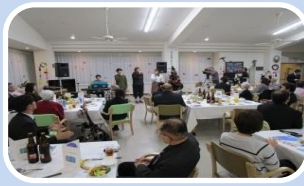
▲ クリスマス&忘年会