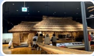
▲ 北海道博物館見学